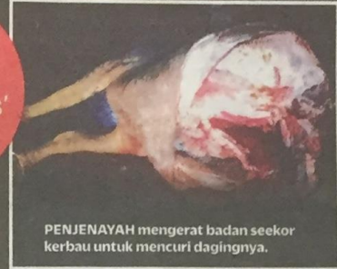
PENJENAYAH mengerat badan seekor kerbau untuk mencuri dagingnya.

Geng curi ternakan 'mengganas' di Jerantut