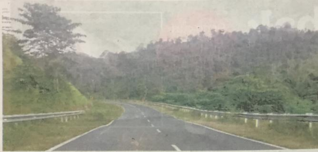
Di Jalan Ulu Tembeling, Jerantut inilah geng curi ternakan menembak kerbau yang berkeliaran.

"Bagaimanapun, pada malam Rabu lalu, tiga ekor lagi kerbau-nya ditembak dan dagingnya cuba dilarikan pencuri mengu-