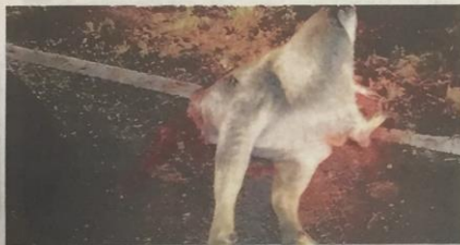
SEPARUH badan kerbau yang tidak sempat dilarikan penjenayah ditemui di Jalan Ulu Tembeling, Jerantut pada Rabu lalu.