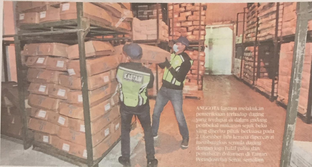
ANGGOTA Kastam melakukan pemeriksaan terhadap daging yang terdapat di dalam gendang pembekal makanan sejuk beku yang disertu pihak berkuasa pada 2 Disember lalu kerana dipercayai membungkus semula daging dengan logo halal palsu dan memalsakan dokumen di Taman Perindustrian Senai, semalam.