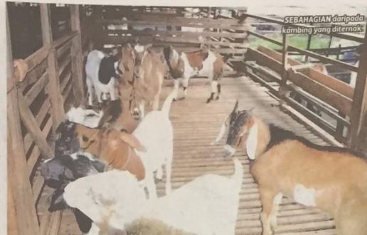
SEBAHAGIAN daripada kambing yang diternak