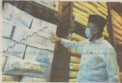
TOSRIN memeriksa daging sejuk beku yang diragui status halalnya di sebuah gudang di Taman Perindustrian Idaman, Senai, Kulai semalam.

"Manakala Kementerian Perdagangan Dalam Negeri dan Hal Ehwal Pengguna (KPDNHEP) merampas daging sejuk beku yang menggunakan tanda logo