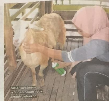
TAHAP pesihatan setiap ternakan tidak pernah diabaikan