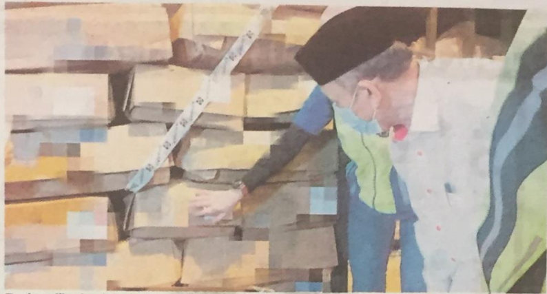
Tosrin melihat kotak daging sejuk beku di gudang yang menjadi proses penukaran label halal di Taman Perindustrian Senai, semalam.

Beliau berkata, pihaknya tidak menafikan kemungkinan ada pi-